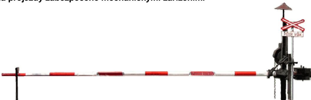
Obr. 2 - Závora mechanického přejezdového zabezpečovacího zařízení.